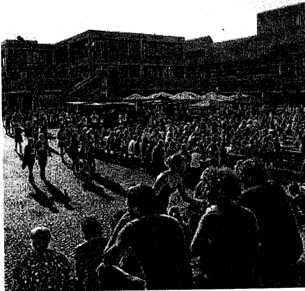
Wie hier im Jahr 2012 lockt das Sommerfest der Universität Regensburg jedes Jahr viele Besucher an.

Am Donnerstag gibt es von 17 bis 24 Uhr ein buntes Programm auf dem Campus – mit Musik, Tanz, Führungen und einer Experimentalvorlesung.