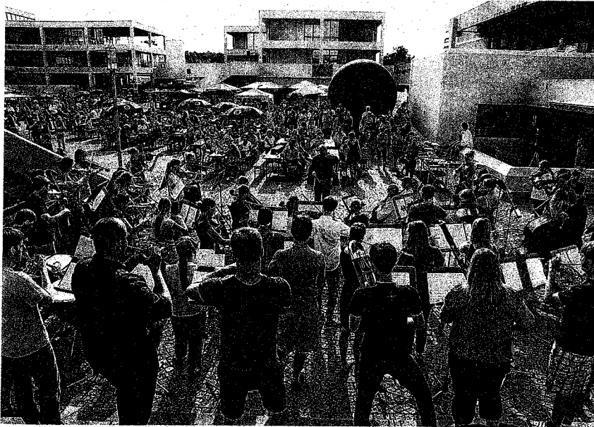
Das Symphonieorchester der Universität eröffnete das Sommerfest mit der „Feuerwerksmusik“.

Ansprache verwies er auf die „lange und schöne Tradition“, die das Sommerfest an der Universität habe. „Es ist ein toller Abend mit Musik, Shows und schönen Gesprächen“, so Hebel. Bereits am Wochenende wird an der Universität wieder gefeiert: das zweite große Ehemaligen-Treffen steht an.