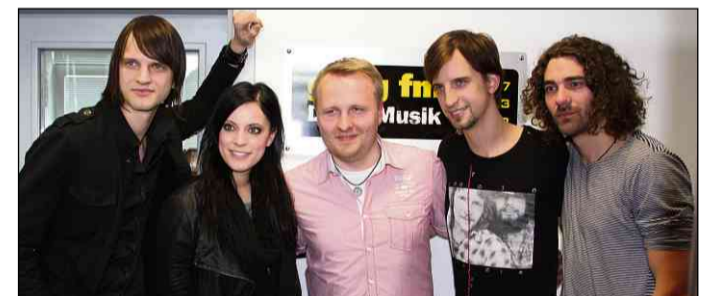
Rocken den Donnerstag: Thomas Stolle, Stefanie Kloß mit Moderator Jonas Pfeifer, Johannes Stolle und Andreas Nowak (v.li.)