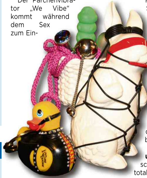
Der Osterhase von Lust und Liebe hat alles dabei, was in puncto Sexspielzeug derzeit angesagt ist

Lust auf Elektro-Sex? Dann kommt „Lob und Tadel“ gerade recht. Ein ferngesteuertes Vibrations-Ei „lobt“ oder „tadeln“ dabei den Partner. Das funktioniert mit Reizstrom, natürlich variabel einstellbar für größtmögliche Ekstase. Wilder geht's nimmer.