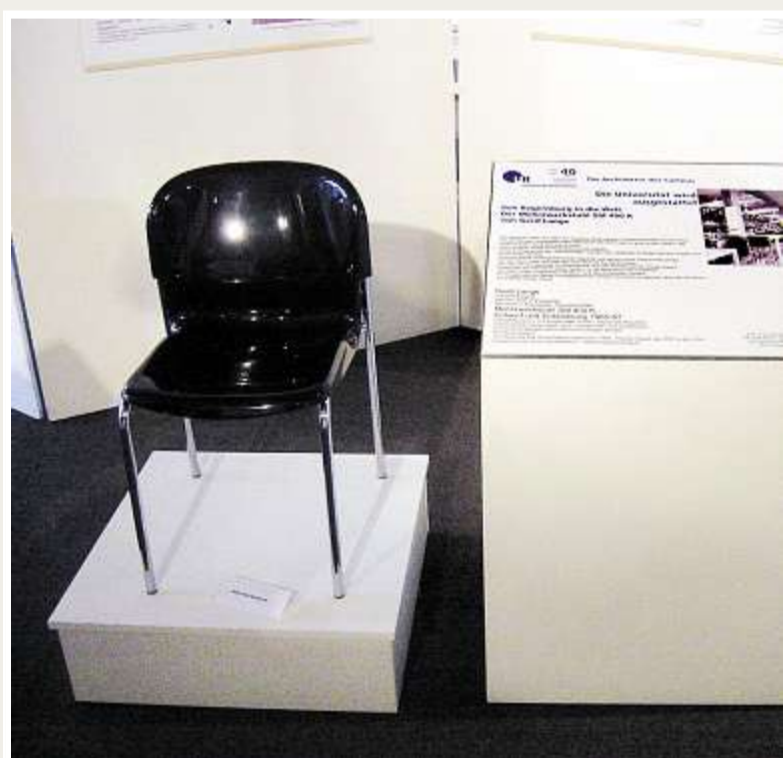
Der SM 400 K verrichtet seit 40 Jahren seinen Dienst an der Uni